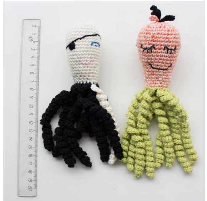
Disse sprutter har en helt optimal størrelse - dog er alle størrelser af sprutter meget velkomne så længe deres arme ikke er længere end 22 cm udstrakt og de er hæklet i 100% bomuld :)

( Hvis du har problemer med at få armene til at sno så hæk evt. 3 eller 4 fm i hver lm istedet - se en billedevejledning på www.lindersverden.blogspot.dk/2013/04/spruttearme-et-lille-tip.html )